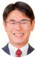
奈良県知事 山下 真