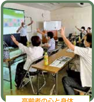
高齢者の心と身体 認知症予防の知識を楽しく学べます。