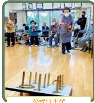
公式ワナゲ 「考えて投げる」頭も体も使うスポーツです。