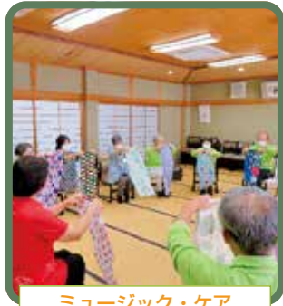
ミュージック・ケア 楽しい先生と一緒に音楽に合わせて体を動かします。