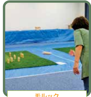
モルック 木の棒を投げて木製のピンを倒し50点になれば勝ち!